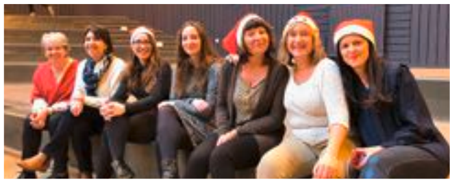
L'équipe de la crèche

Cette année encore, le mois de décembre fut riche en spectacles. Tout a commencé par du théâtre muet : « L'étrange cadeau » , un spectacle proposé aux parents et enfants participant au Relais d'Assistantes Maternelles. C'est avec bonheur et curiosité que petits et grands se sont retrouvés pour découvrir le secret caché au cœur de cette grosse boîte, nous transportant dans un monde mystérieux et drôle. Ce fut ensuite le tour des enfants de notre crèche de s'inviter à la représentation du « Noël de Nini » . La magie de Noël était bien là, Nini a décidé d'attendre le Père Noël. Tout en décorant le sapin, sa maman va lui raconter des histoires et lui chanter des chansons pour essayer de la faire dormir.